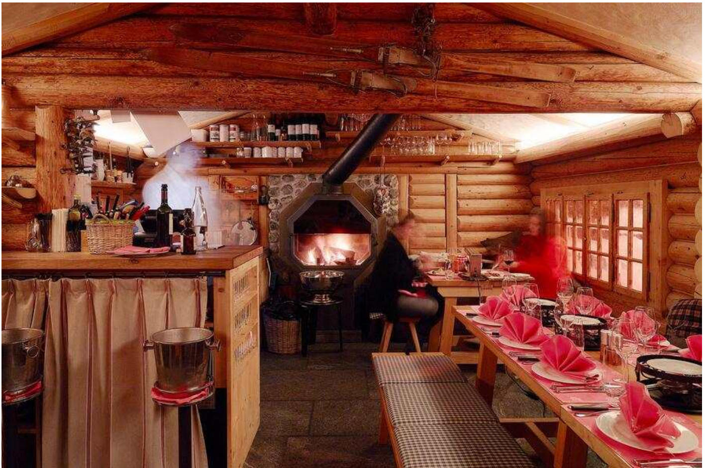
Fondue oder Guggeli? Die wenigen Tische im «Le Petit Chalet» in Park sind sehr begehrt.

«PETIT CHALET» ODER IGLU? «Le Grand Bellevue» ist klein und fein. Nur 57 Zimmer, also etwa 100 Gäste. Die können nicht wie gewohnt durch die Gstaader Top-Restaurantszene surfen und zwischendurch beim Nachbarn schlemmen, aber das Angebot im Haus ist riesig. Im grossen Park wurde aufgerüstet: «Le Petit Chalet» steht da, eine hübsche Holzhütte mit nur wenig Tischen. Der ungewöhnliche Mix auf der Karte: Guggeli & Fondue! Die Poulets stammen aus dem Greyerzerland, werden mit Pommes serviert. Beim Fondue gibt es den Klassiker: moitié-moitié, halb Gruyère, halb Vacherin. Und Alternativen: Ziegenkäse-Fondue (!), wie fast überall in Gstaad auch Trüffel-Fondue. Ein Chinoise kriegt man auch, auf Vorbestellung. Im Park stehen erstmals auch transparente «Iglus». General Manager und Besitzer Daniel Koetser: «Ein Ort zum Relaxen. Gut geheizt, mit Fellen ausgestattet. Wir servieren in den «Iglus» Champagner und Austern.» The good life. Auch in Shutdown-Zeiten. (Bellevue zwischen den verschneiten Bäumen)